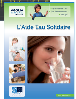
Programme « Eau solidaire »