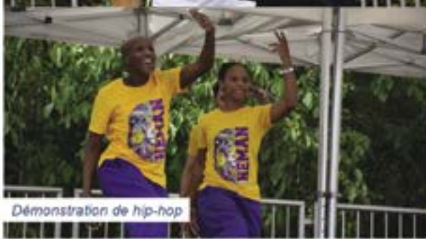
Démonstration de hip-hop