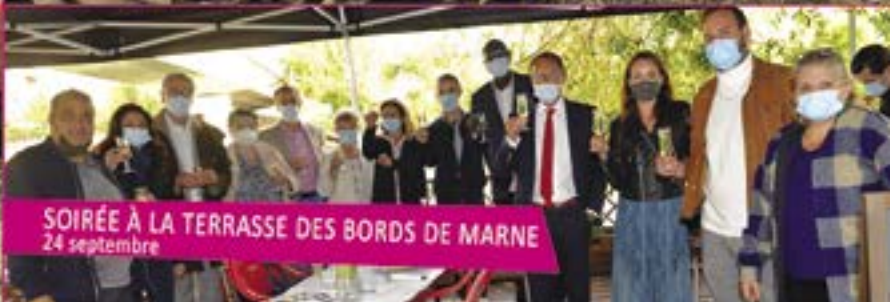
SOIRÉE À LA TERRASSE DES BORDS DE MARNE 24 septembre