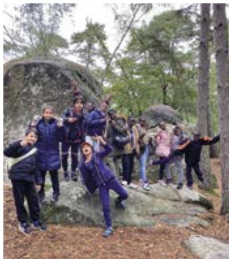
Sortie en forêt

La ville de Neuilly-Plaisance met tout en œuvre pour que la jeunesse nocéenne puisse continuer à profiter de sorties, d'animations, tout en tenant compte du protocole sanitaire strict.