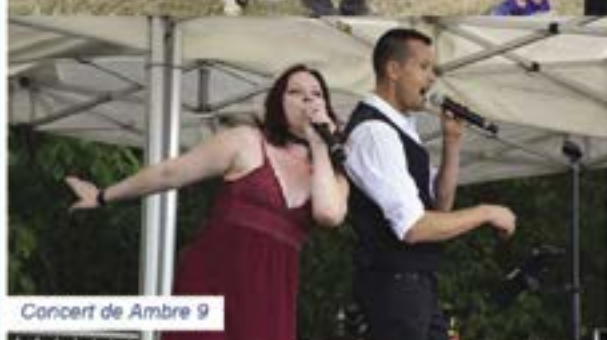
Concert de Ambre 9