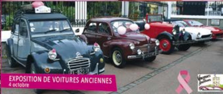
EXPOSITION DE VOITURES ANCIENNES 4 octobre