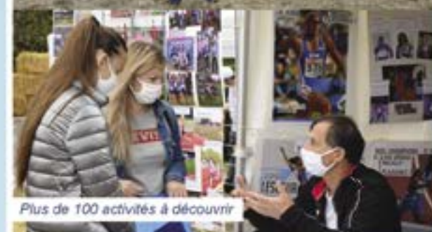
Plus de 100 activités à découvrir