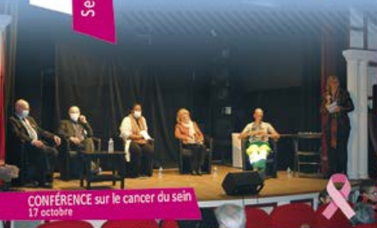
CONFÉRENCE sur le cancer du sein 17 octobre