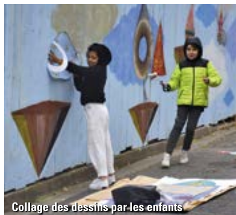
Collage des dessins par les enfants

Prochaine étape : l'intégration des signatures des enfants sur la palissade.