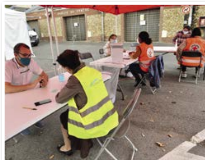
Prise de renseignements par la Croix Rouge