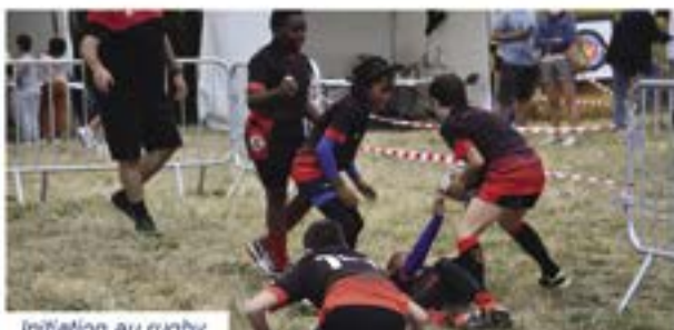
Initiation au rugby