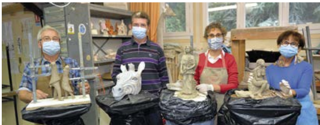
L’Atelier de Plaisance Sculpture , Centre Municipal d’Activités du Plateau d’Avron, 44 avenue des Fauvettes (1 er étage). www.atelier-plaisance-sculpture.com . Tél : 06 61 17 04 65 et 06 88 19 70 02.