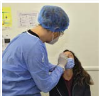
Test PCR réalisé par une infirmière