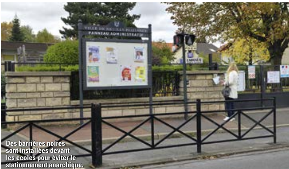
Des barrières noires sont installées devant les écoles pour éviter le stationnement anarchique.