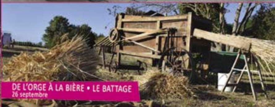
DE L'ORGE À LA BIÈRE • LE BATTAGE 26 septembre