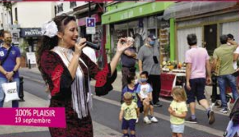
100% PLAISIR 19 septembre