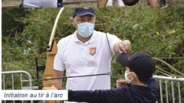
Initiation au tir à l'arc