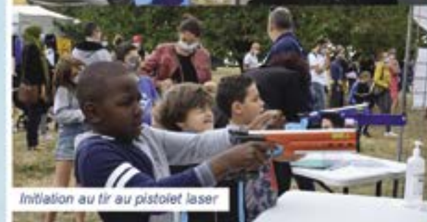
Initiation au tir au pistolet laser