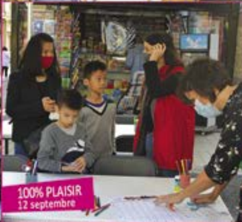
100% PLAISIR 12 septembre