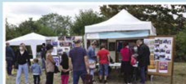
Toutes les associations et services de la ville présents