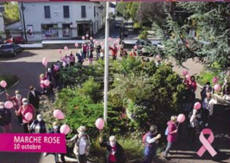
MARCHE ROSE 10 octobre