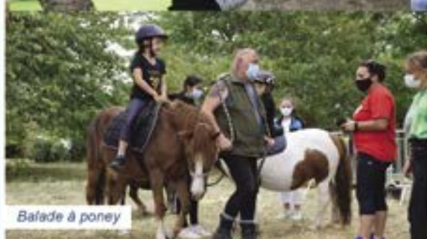
Bafade à poney