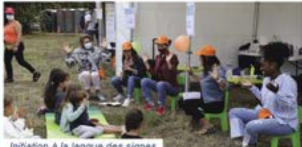
Initiation à la langue des signes