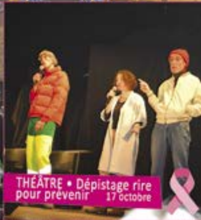
THÉÂTRE • Dépistage rire pour prévenir 17 octobre