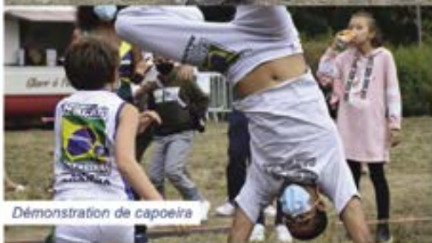
Démonstration de capoeira