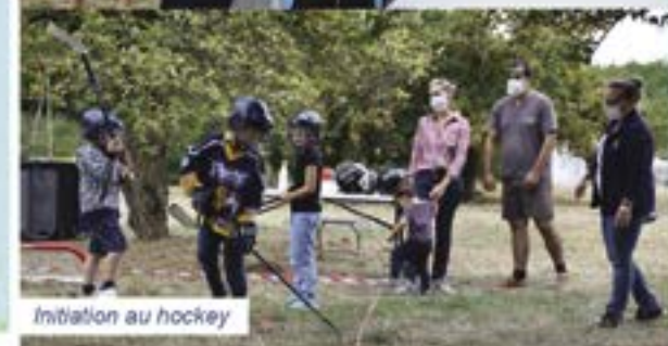
Initiation au hockey