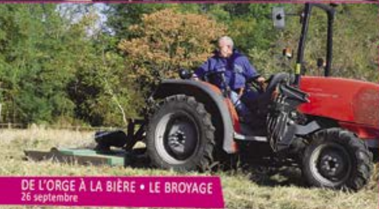
DE L'ORGE À LA BIÈRE • LE BROYAGE 26 septembre