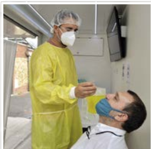
Test PCR nasopharyngé