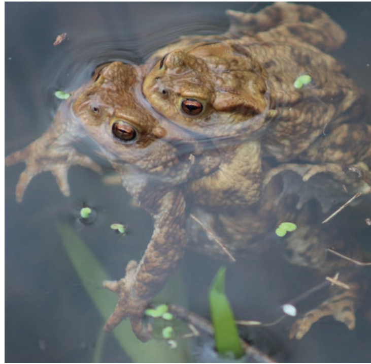
Le biotope des Mares est le repère des espèces aquatiques

Ces zones sont inscrites comme non constructibles dans les documents d'urbanisme. Ils ne sont pas seulement des espaces de conservation, ce sont aussi des lieux de sensibilisation et de découverte. Des balades guidées sont régulièrement organisées par la Municipalité pour éduquer les Nocéens à l'importance de la préservation de ces milieux particulièrement fragiles.