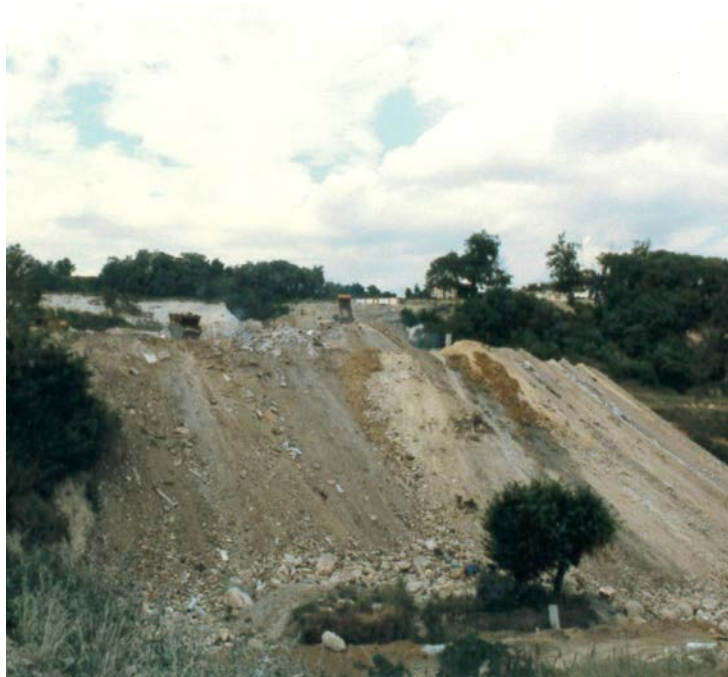
Les anciennes carrières sont devenues le parc exceptionnel que l'on connaît aujourd'hui