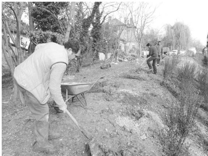
La Voie Lamarque 3 est le résultat d'un travail collectif où même la jeunesse nocéenne a mis la main à la pâte.

C'était particulièrement difficile et fatigant, vu que le terrain est en pente. Mais l'ambiance avec les collègues était bon enfant. Je me souviens qu'on avait un petit tracteur. En fin de journée, on était tellement épuisés qu'on s'asseyait dans le godet (ndlr : accessoire placé à l'avant du chargeur pour transporter les matériaux), on tenait alors les brouettes pleines de détrit, et on se faisait tracter jusqu'en haut ! »