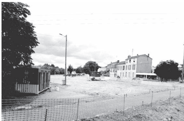
Il y a encore quelques années, les bords de Marne ressemblaient à un vaste terrain vague

Neuilly-Plaisance, qui se trouve dans une zone fortement urbanisée, ressent déjà les conséquences des îlots de chaleur urbains. Étant située près de la Marne, elle est vulnérable à des inondations renforcées par des pluies torrentielles et des débordements de rivières, des événements qui devraient augmenter avec le changement climatique. Une meilleure gestion des eaux, notamment de pluie est donc indispensable. « Nous sommes en train de réfléchir à mettre en place un bac de récupération d'eau de pluie au cimetière. Nous réduisons les arrosages avec l'eau potable en favorisant le paillage des plantes xérophiiles, des plantes moins gourmandes en eau et nous favorisons les plantes rustiques », précise Marine Divo, responsable du service Espaces verts et Propreté urbaine de la commune. Et de compléter : « nous sommes en gestion durable des parcs, jardins et paysages. Le but ? Réduire les passages de tontes, augmenter les hauteurs de coupes de l'herbe et faire des fauchages tardifs ». Mais ce n'est pas tout. Le service a également planté 10 000 bulbes ; remplacé les colonnes fleuries nécessitant beaucoup d'eau par des plantes vivaces ; paillé systématiquement tous les massifs de la ville y compris dans les écoles pour limiter le désherbage et l'arrosage afin de ne pas laisser pas le sol à nu pour favoriser la vie microbienne.